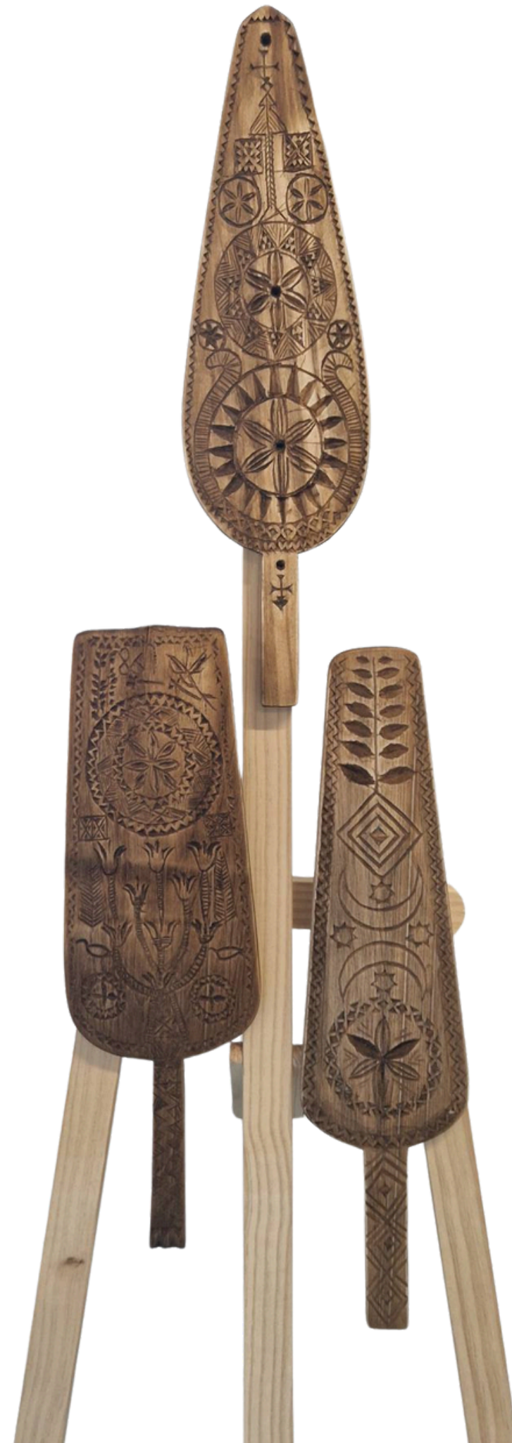
Iš parodos „Aukštaitiškos verpstės ir prieverpstės“ https://zarasuose.lt/paroda-aukštaitiskos-verpstes-ir-prieverpstes/