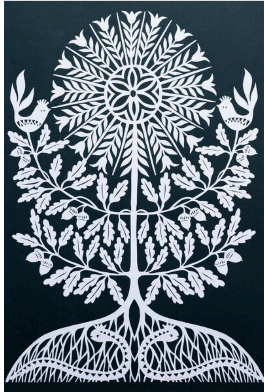
Popieriaus karpinys „Lietuviškas gyvybės medis“. Sukurtas 2020 m. Tauragės krašto muziejuje „Santaka“ vykusio respublikinio karpinių plenero „Tautodailė vydiūniška dvasia“ metu. https://www.europeana.eu/de/item/2021802/LIMIS_726758186