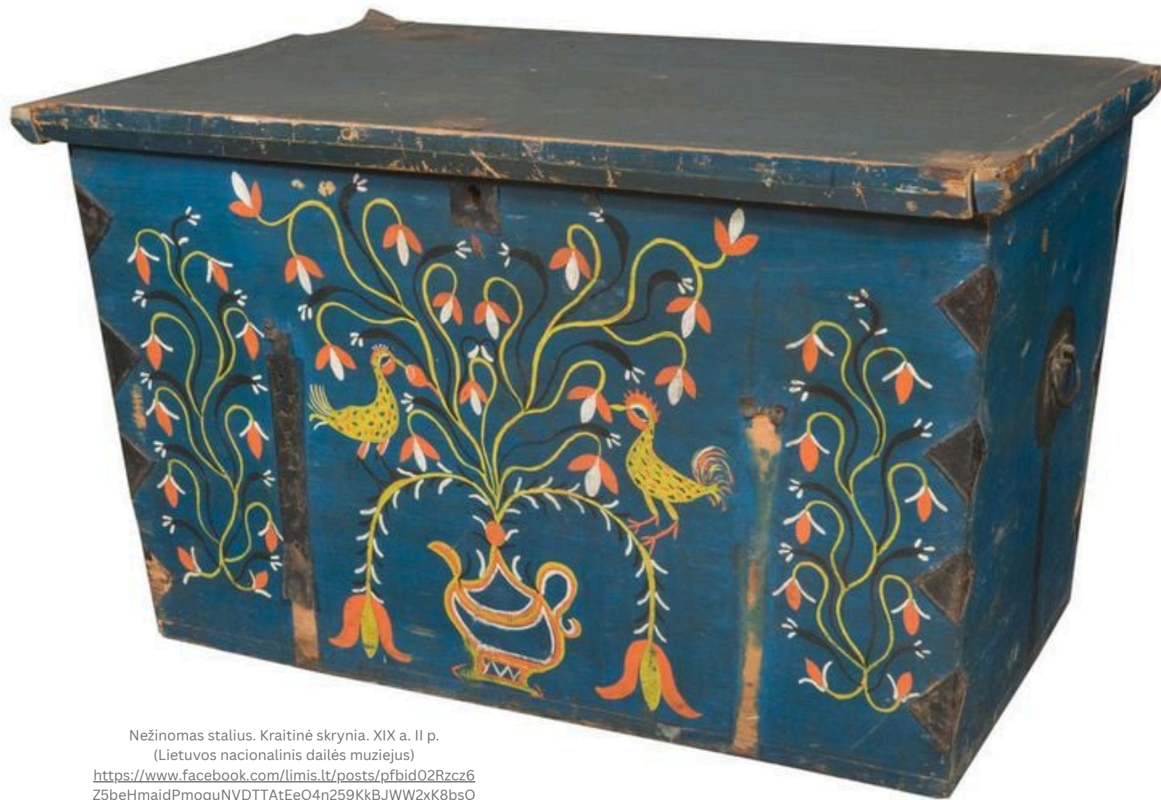
Nežinomas stalius. Kraitinė skrynia. XIX a. II p. (Lietuvos nacionalinis dailės muziejus) https://www.facebook.com/limis.lt/posts/pfbid02Rzcz6Z5beHmajdPmoquNVDTTAtEeQ4n259KkBJWW2xK8bsQu2KzFXN5hcDas2pZWl