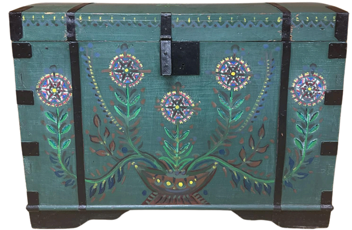
Kuparas (Elektrėnų krašto muziejus) https://www.facebook.com/ElektrenuKrastoMuziejus/posts/kuparas-kraitin%C4%97-skrynia-kurioje-laikydavo-drabu%C5%BFIus-ir-audinius-prad%C4%97ta-naudoti/122209280558162107/