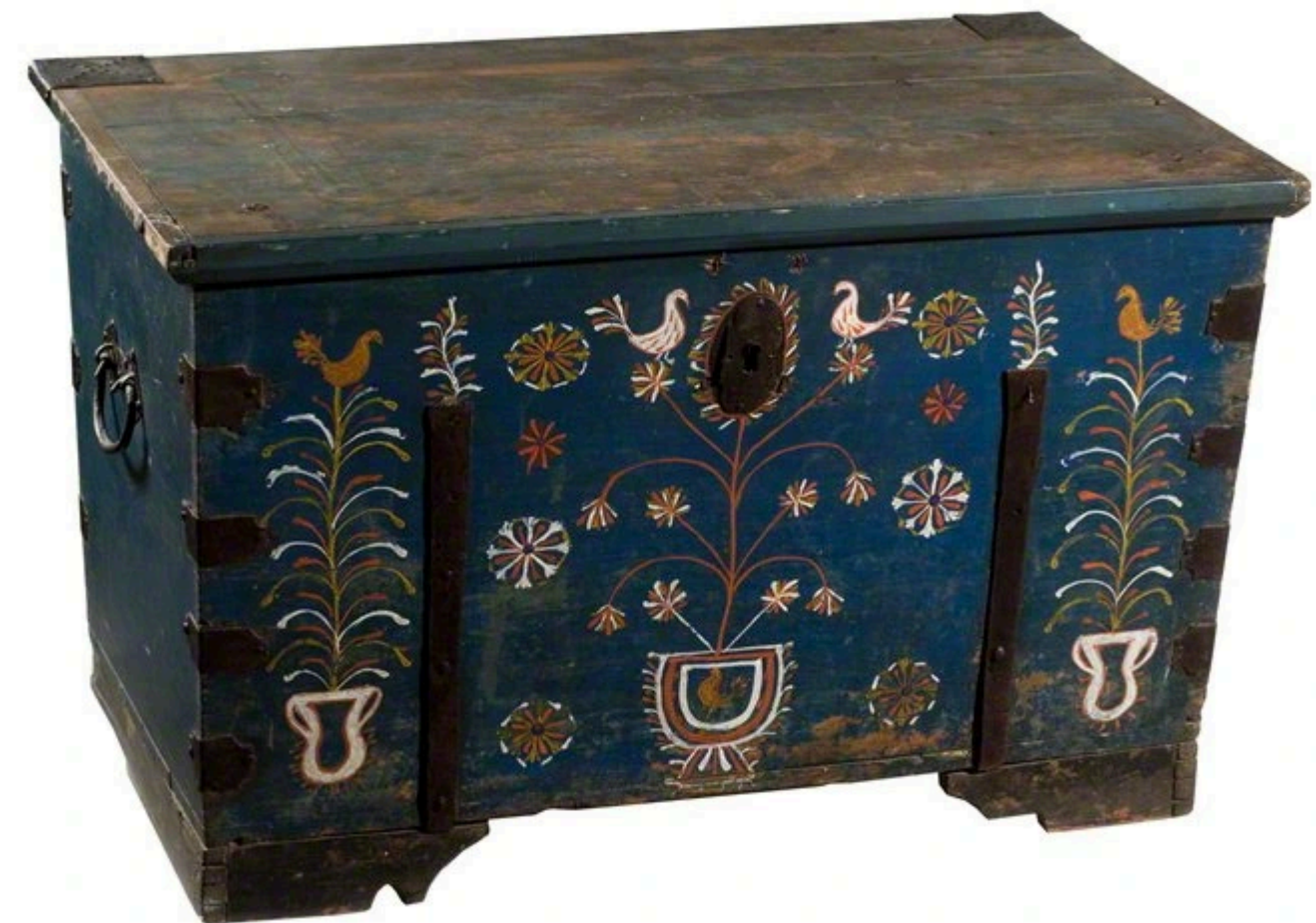
Kraitinė skrynia (Lietuvos nacionalinis dailės muziejus)