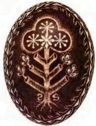
Baltai.lt šiandien https://www.facebook.com/story.php?story_fbid=3734014140002320&id=100064558275478&rdid=V9nRu7OjjsuK9EKu#