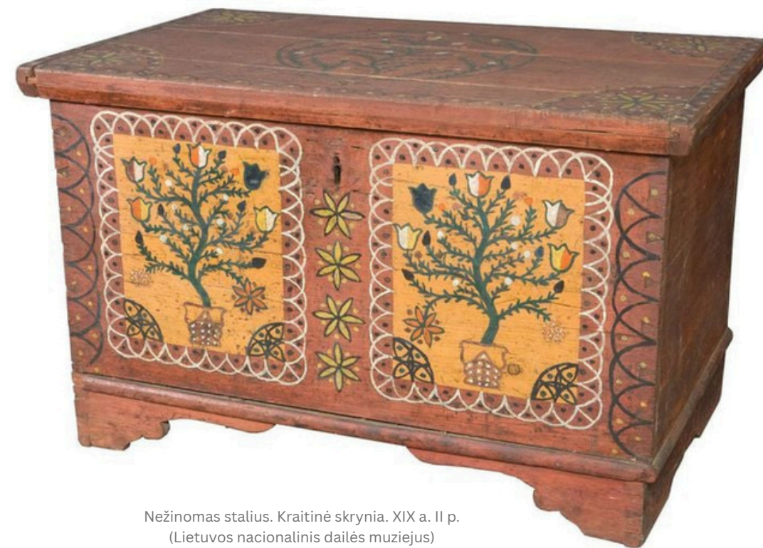
Nežinomas stalius. Kraitinė skrynia. XIX a. II p. (Lietuvos nacionalinis dailės muziejus) https://www.facebook.com/limis.lt/posts/pfbid02Rzcz6Z5beHmajdPmoquNVDTTAtEeQ4n259KkBJWW2xK8bsQu2KzFXN5hcDas2pZWl